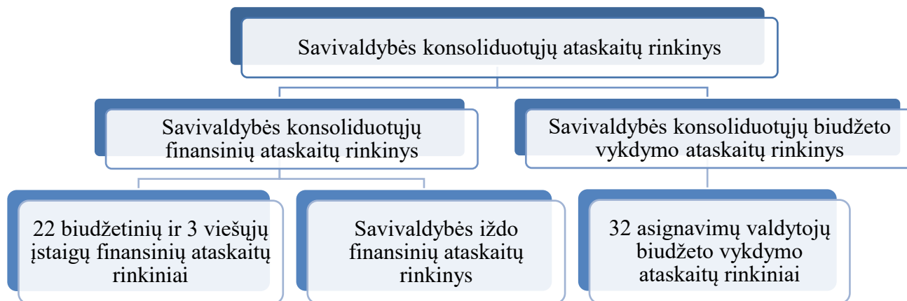
2 pav. Zarasų rajono savivaldybės 2019 metų konsoliduotųjų ataskaitų rinkinio sudėtis

Zarasų rajono savivaldybės 2019 metų konsoliduotųjų ataskaitų rinkinio sudėtis: