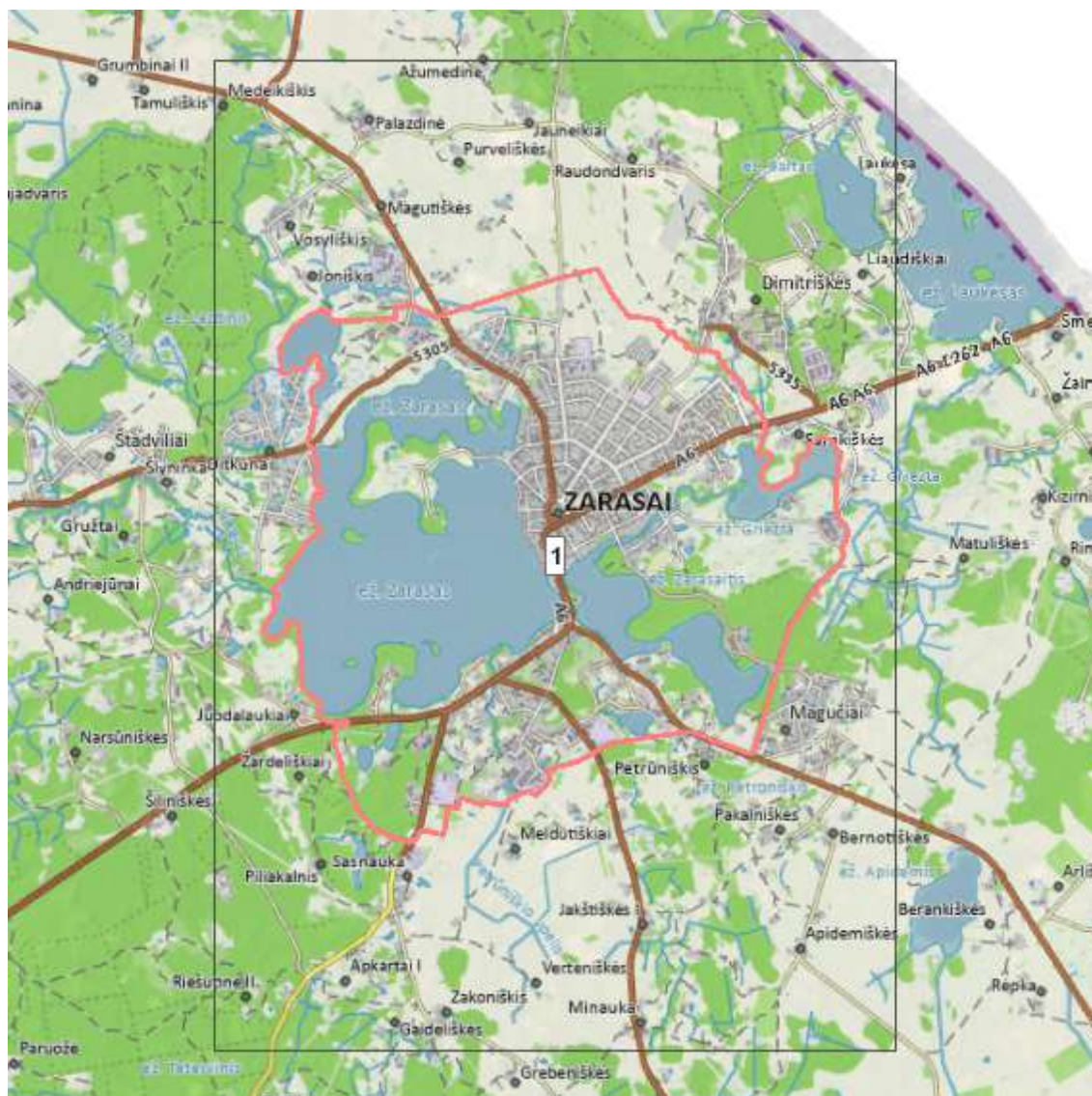
Situacijos schema, lapų išdėstymas